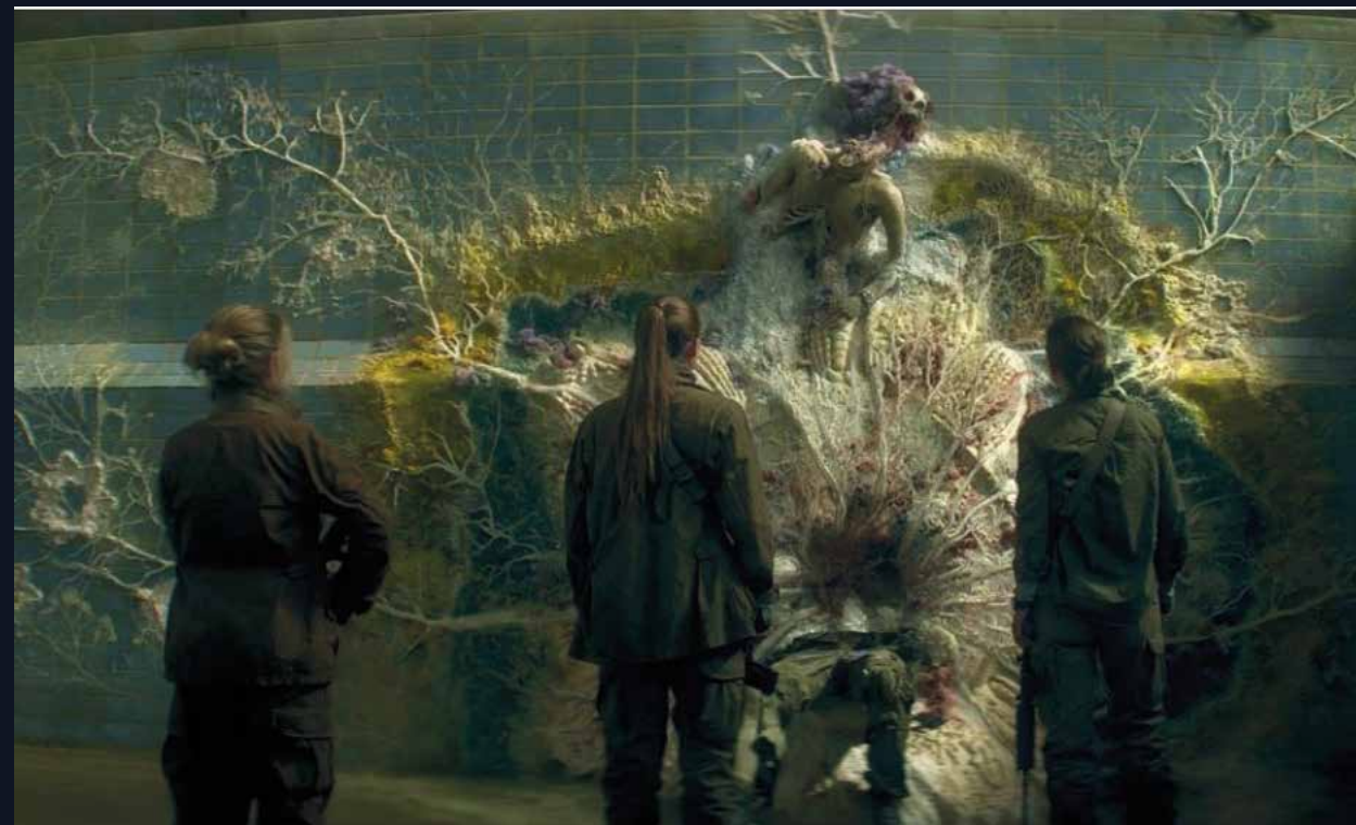
Alex Garland, Annihilation , 2018.

Annihilation est un film de science-fiction sorti en 2018 et réalisé par Alex Garland. Ce réalisateur britannique est aussi connu pour d'autres de ses films de science-fiction à succès. Annihilation combine les règnes animaux et végétales d'une manière très intéressante et surréaliste qui inspire mes pensées sur ce qui peut exister.