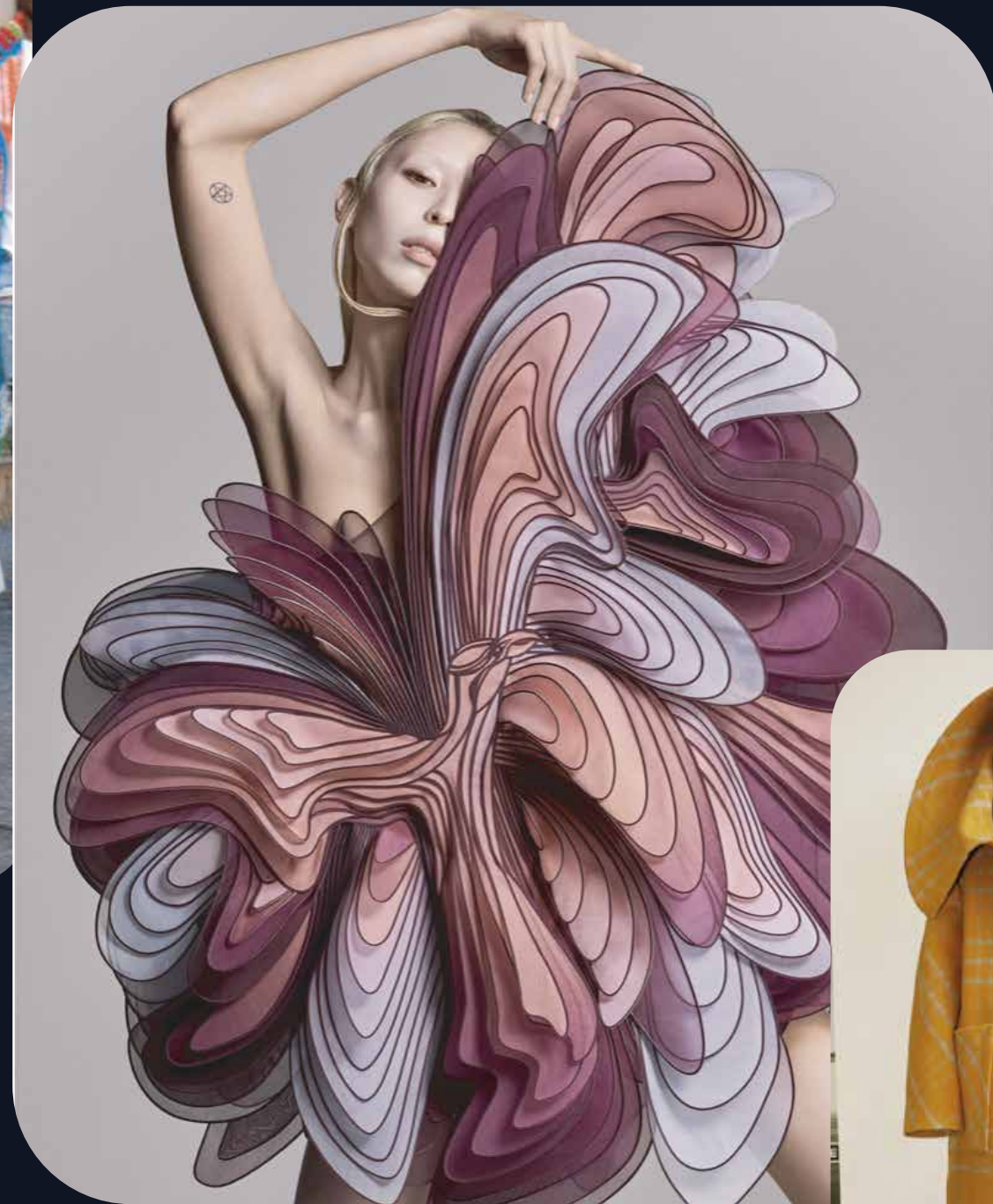
Haute Couture, Iris Van Herpen, printemps 2019