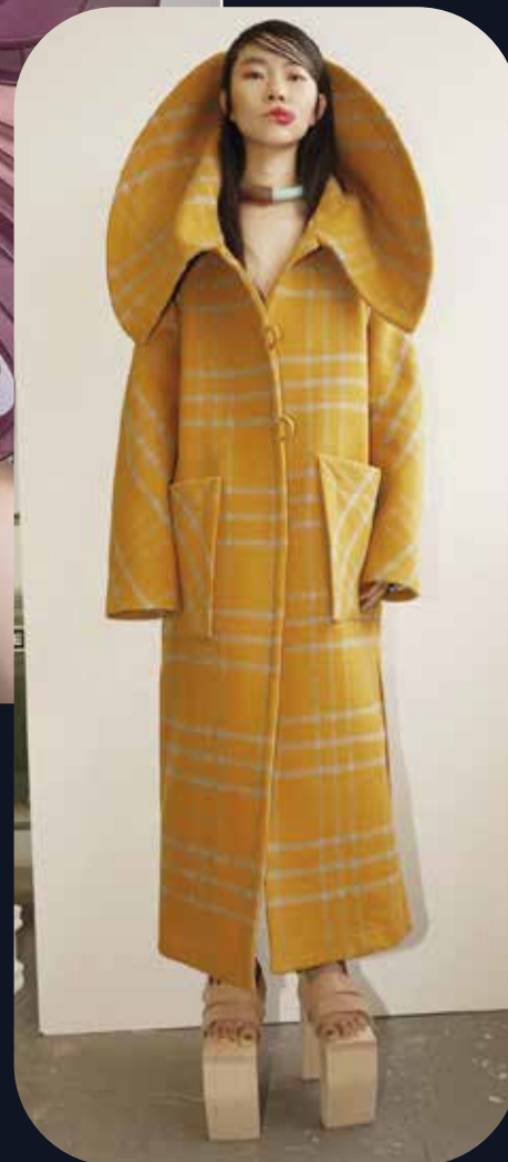
Trench coat, WRKDEPT, automne/hiver 2017.