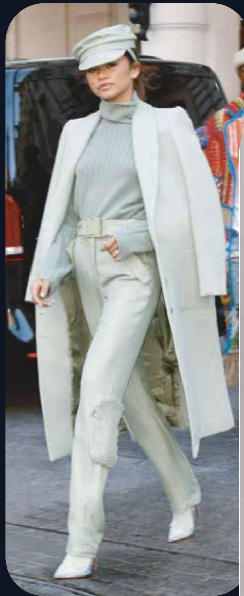
Complet, Paris Sally, automne 2019