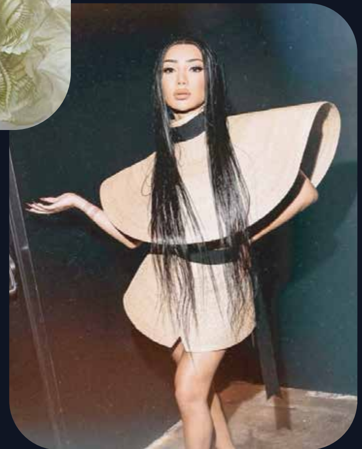
Mini-jupe et haut, Christian Cowen, printemps/été 2019.