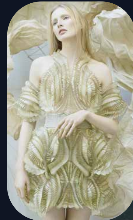
Robe, Iris Van Herpen, printemps 2018