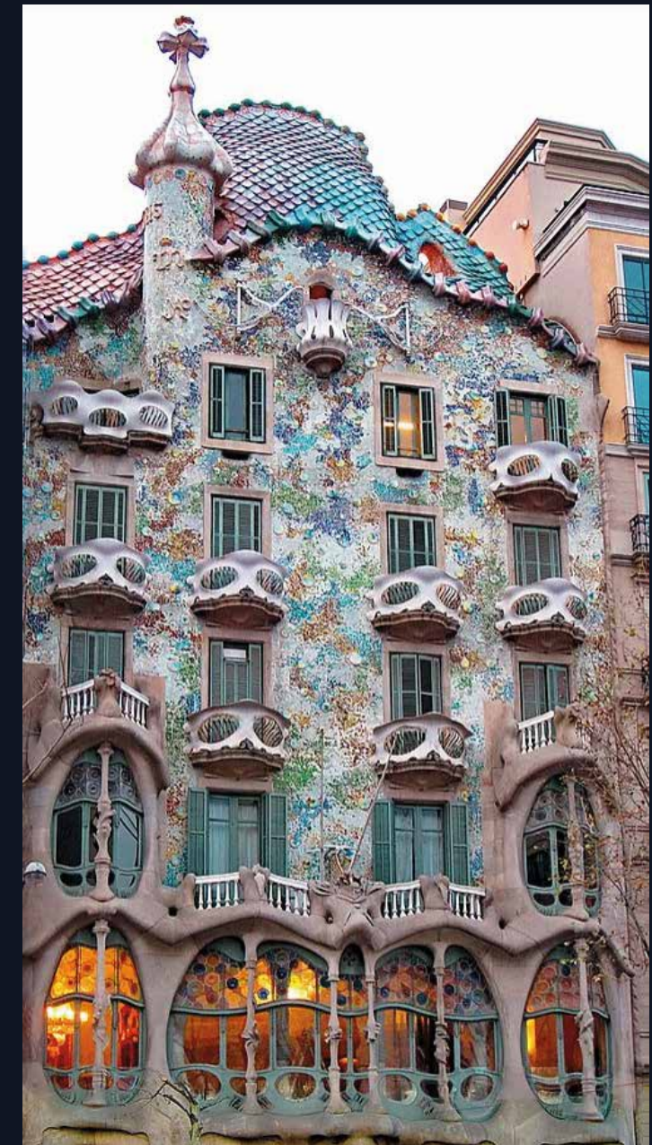
Antoni Gaudí, Casa Batlló, 1904.

Carl Warner est un artiste directeur, auteur et photographe. Né au Royaume-Unis et basé à Londres, il est reconnu surtout pour ses projets créatifs en photographie. La série de photographie Bodyscapes met en scène des corps humains en superposition. Elle m'inspire dans la façon dont elle exploite le corps humain et ses formes afin de représenter gracieusement les paysages de la nature.