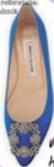
Imagen de referencia: Aquazzura