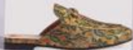
Imagen de referencia: Gucci