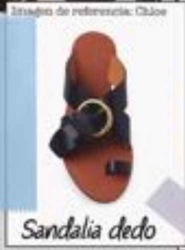
Imagen de referencia: Chloé