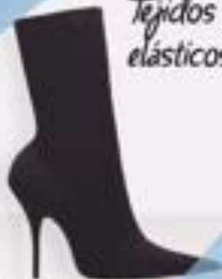
Imagen de referencia: Balenciaga