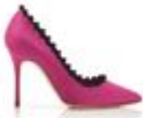
Imagen de referencia: Mancio Zdzuski