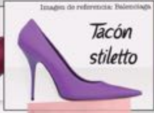
Imagen de referencia: Balenciaga