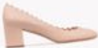
Imagen de referencia: Cbico