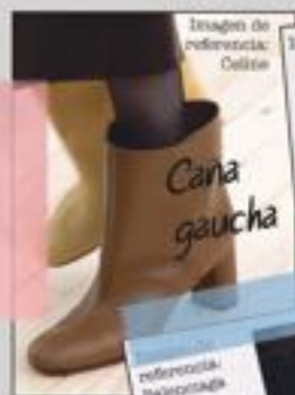
Imagen de referencia: Céline