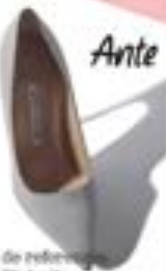
Imagen de referencia: Marco Balzani