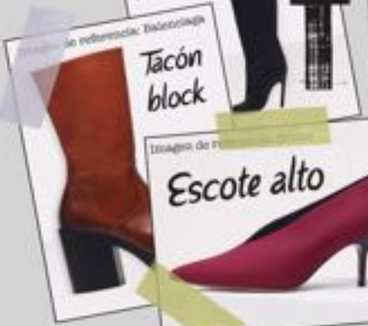
Imagen de referencia: Balenciaga