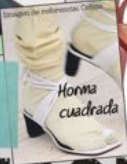
Imagen de referencia: Céline