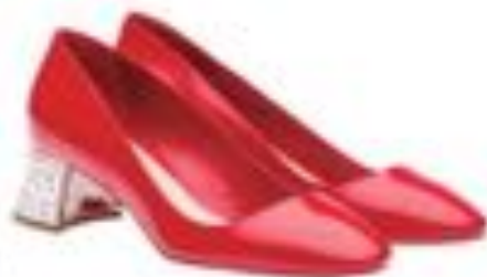
Imagen de referencia: Miu Miu