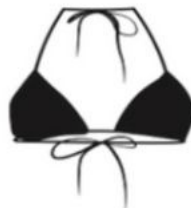
Le Haut Sophia