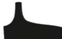
Le Haut Rose