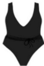
Le une pièce Ana