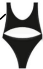
Le une pièce Brit