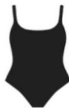
Le une pièce Véro