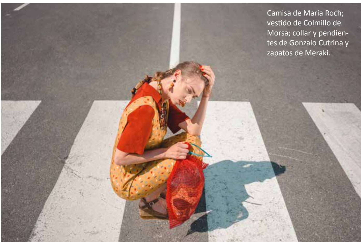
Camisa de Maria Roch; vestido de Colmillo de Morsa; collar y pendien- tes de Gonzalo Cutrina y zapatos de Meraki.