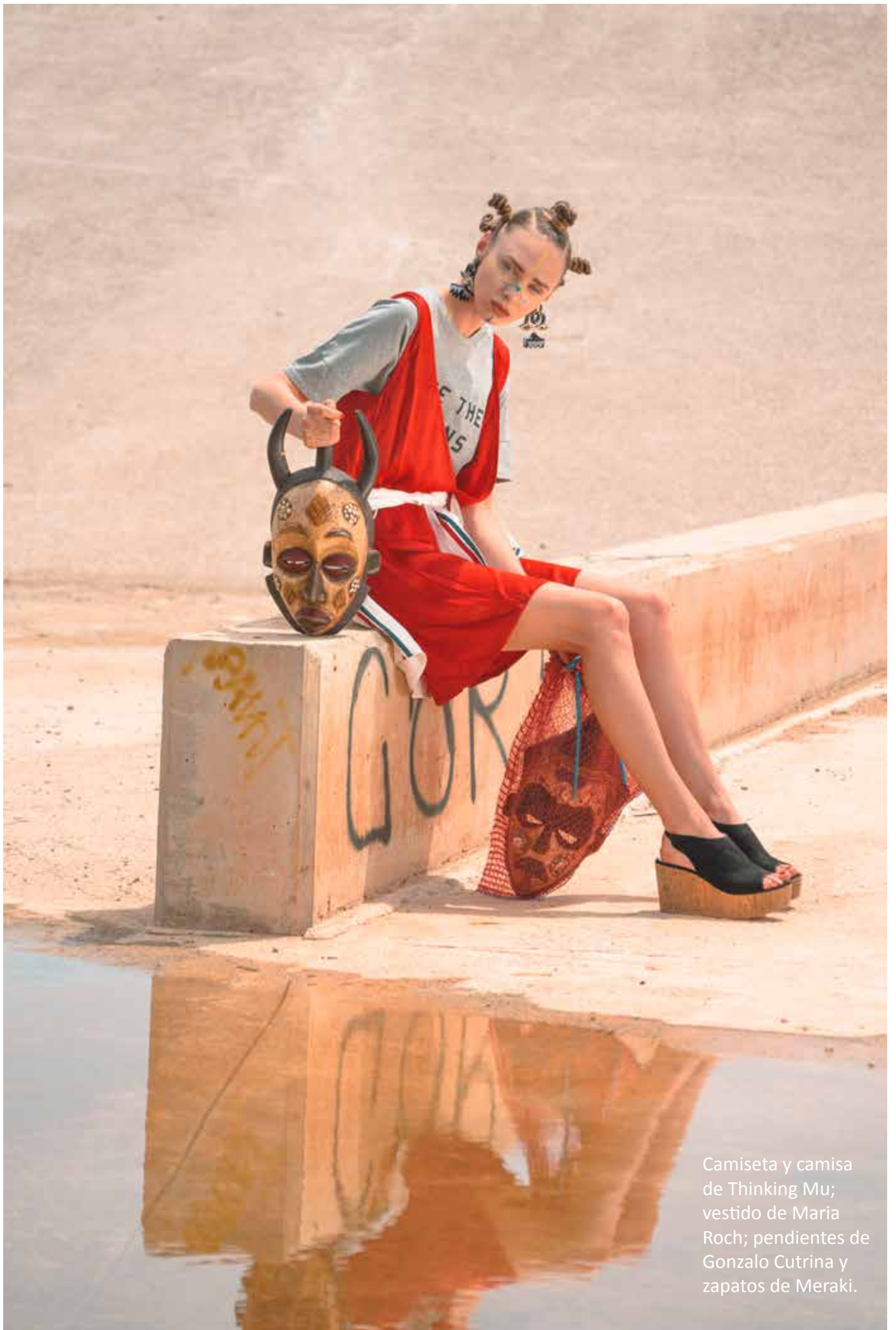
Camiseta y camisa de Thinking Mu; vestido de Maria Roch; pendientes de Gonzalo Cutrina y zapatos de Meraki.