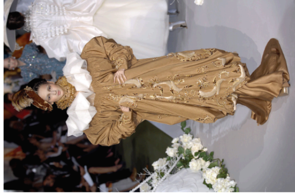
Robe, Christian Dior, Automne Hiver 2007