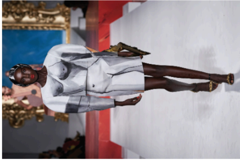
Chemise et jupe, Moschino, Printemps 2020