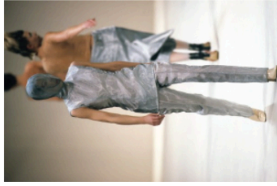
Alexander McQueen, Printemps 1996