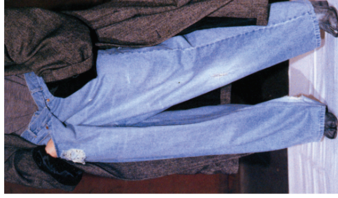
Jeans, Martin Margiela, Automne Hiver 2000