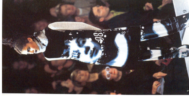
Tunique, Jean-Paul Gaultier, Automne Hiver 1997